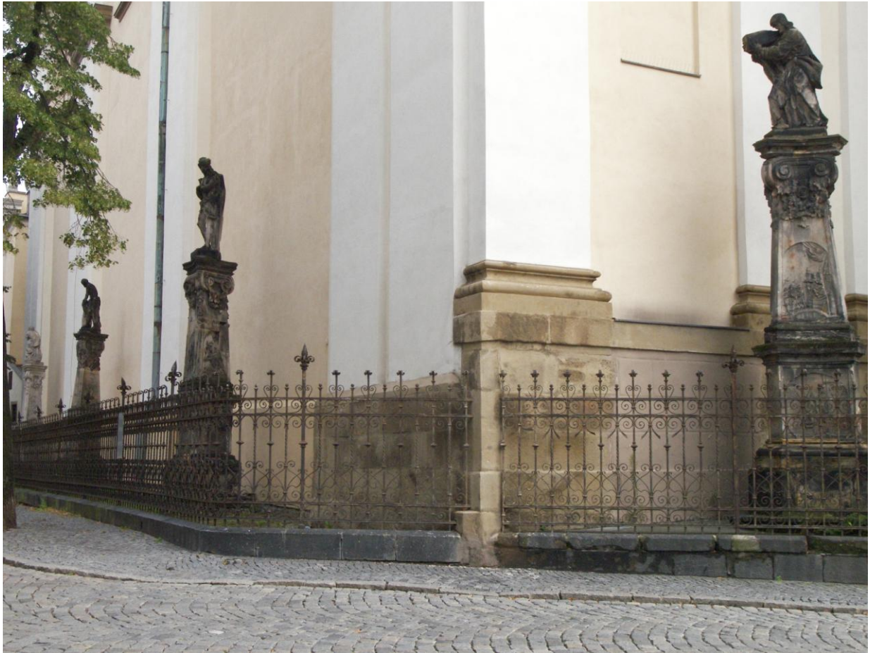
Celkový pohled na současné umístění Bolestného růžence při kostele sv. Michala v Olomouci